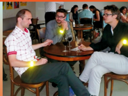
Oslava výročí 10. let Glopolis