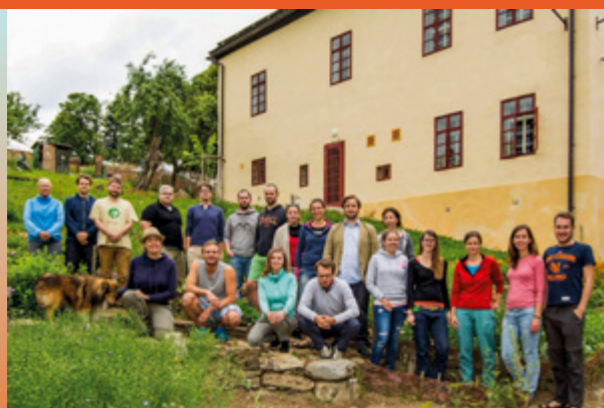
Tým Glopolis na retreatu v Horním Maršově