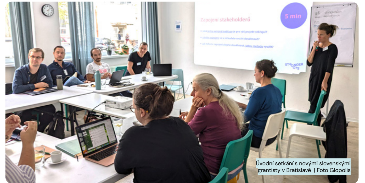
Úvodní setkání s novými slovenskými grantisty v Bratislavě

V roce 2023 jsme připravili podobu druhého cyklu Stronger Roots, vybrali do něj grantisty a rozběhli pro ně podpůrný program. V letech 2023–2025 v konsorciu se 3 partnerskými nadacemi opět podpoříme síť nevládních organizací – konkrétně při budování spolupráce s veřejnými institucemi typu státních úřadů, národních parlamentů či regionálních a místních samospráv, a při vnitřním rozvoji sítí a zapojování stávajících či nových členských organizací do této spolupráce, zejména těch malých a mimo hlavní města.