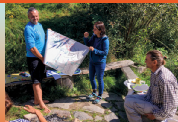
Setkání páteřní skupiny členů NeoN na Hájence u Českého Krumlova