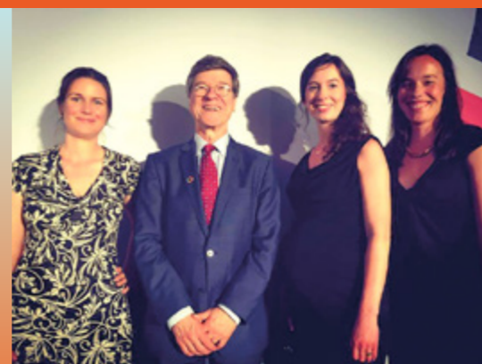
Tým Menu pro změnu s ekonomem Jeffrey Sachsem na Ministerstvu zahraničních věcí ČR