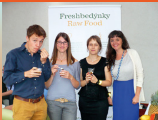
Oslava výročí 10. let Glopolis