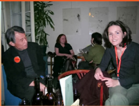
Opening party k založení Glopolis v Hradčany Beams