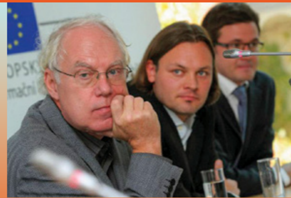
Spuštění projektu Česko hledá budoucnost