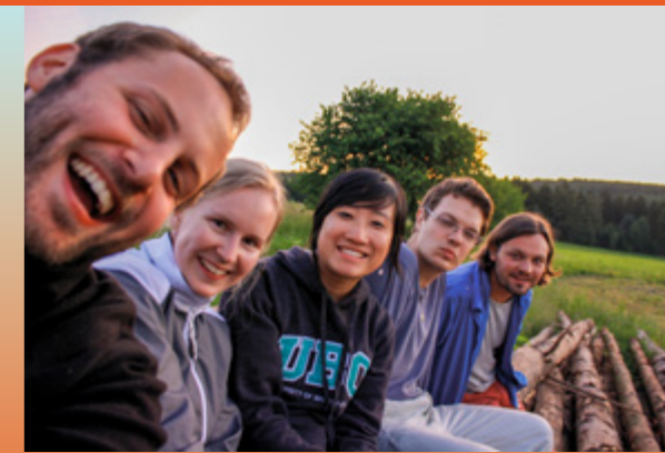
Tým Glopolis čeká na východ slunce na retreatu u Aše