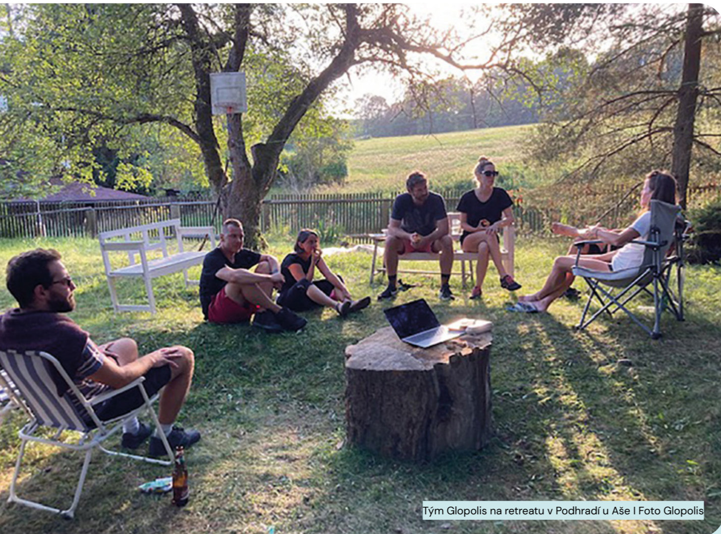
Tým Glopolis na retreatu v Podhradí u Aše