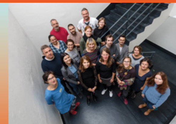
První osobní setkání grantistů programu Stronger Roots v Brně