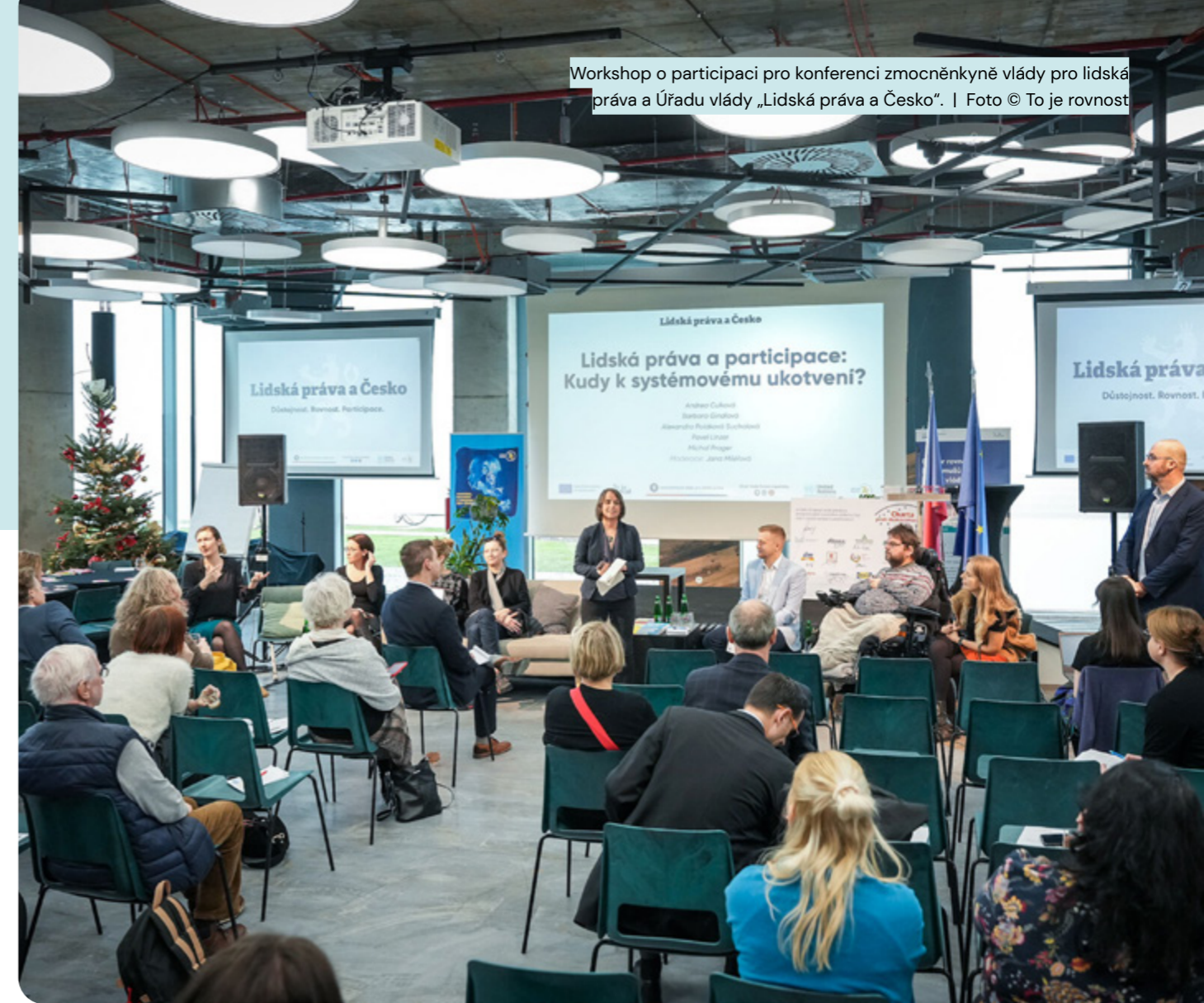
Workshop o participaci pro konferenci zmocněnkyně vlády pro lidská práva a Úřadu vlády „Lidská práva a Česko“.