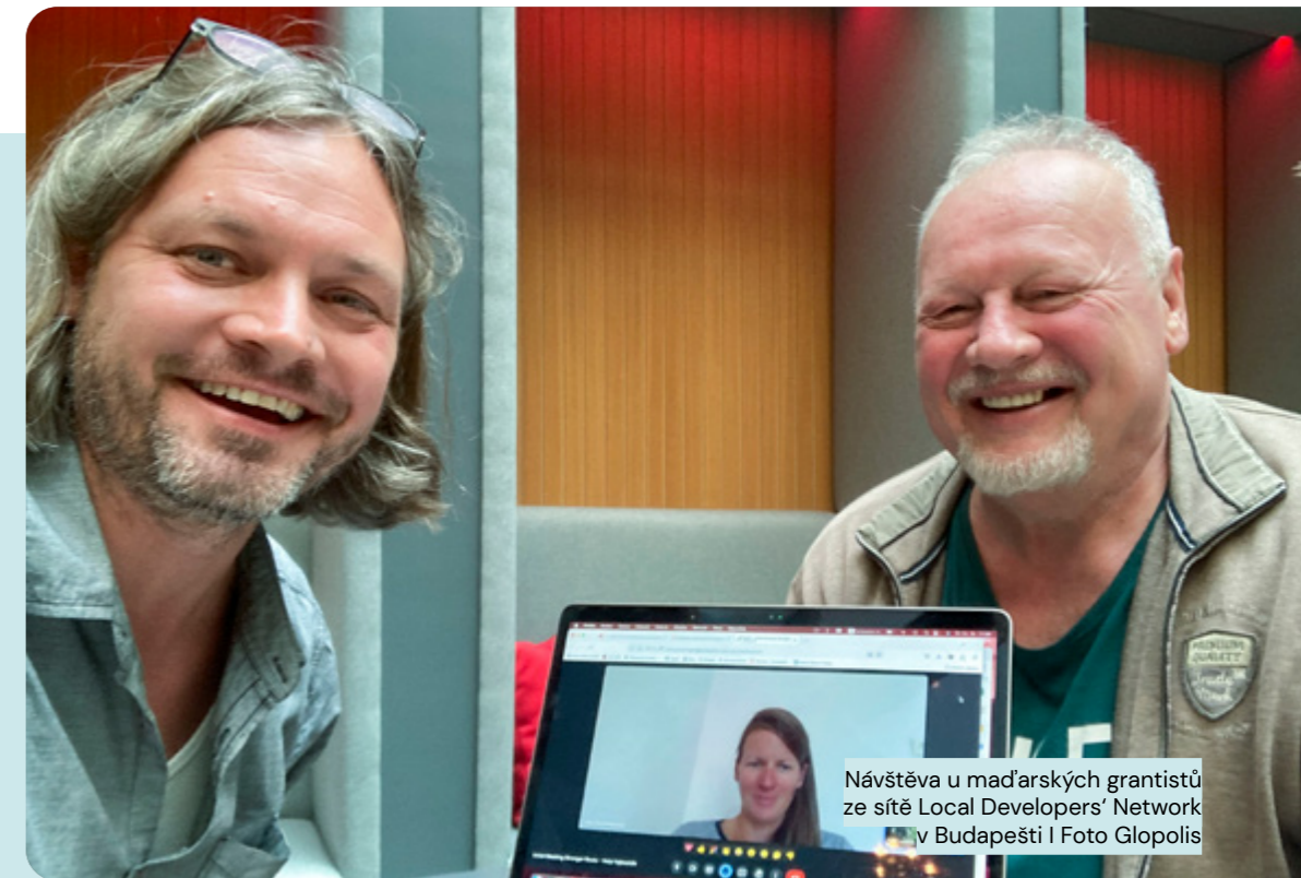
Návštěva u maďarských grantistů ze sítě Local Developers' Network v Budapešti