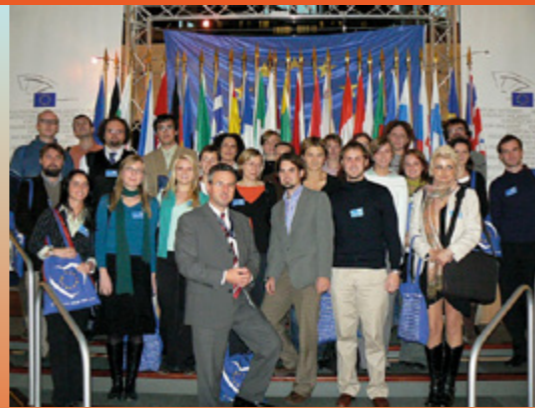
První návštěva českých nevládních organizací působících v rozvojové spolupráci v Evropském parlamentu