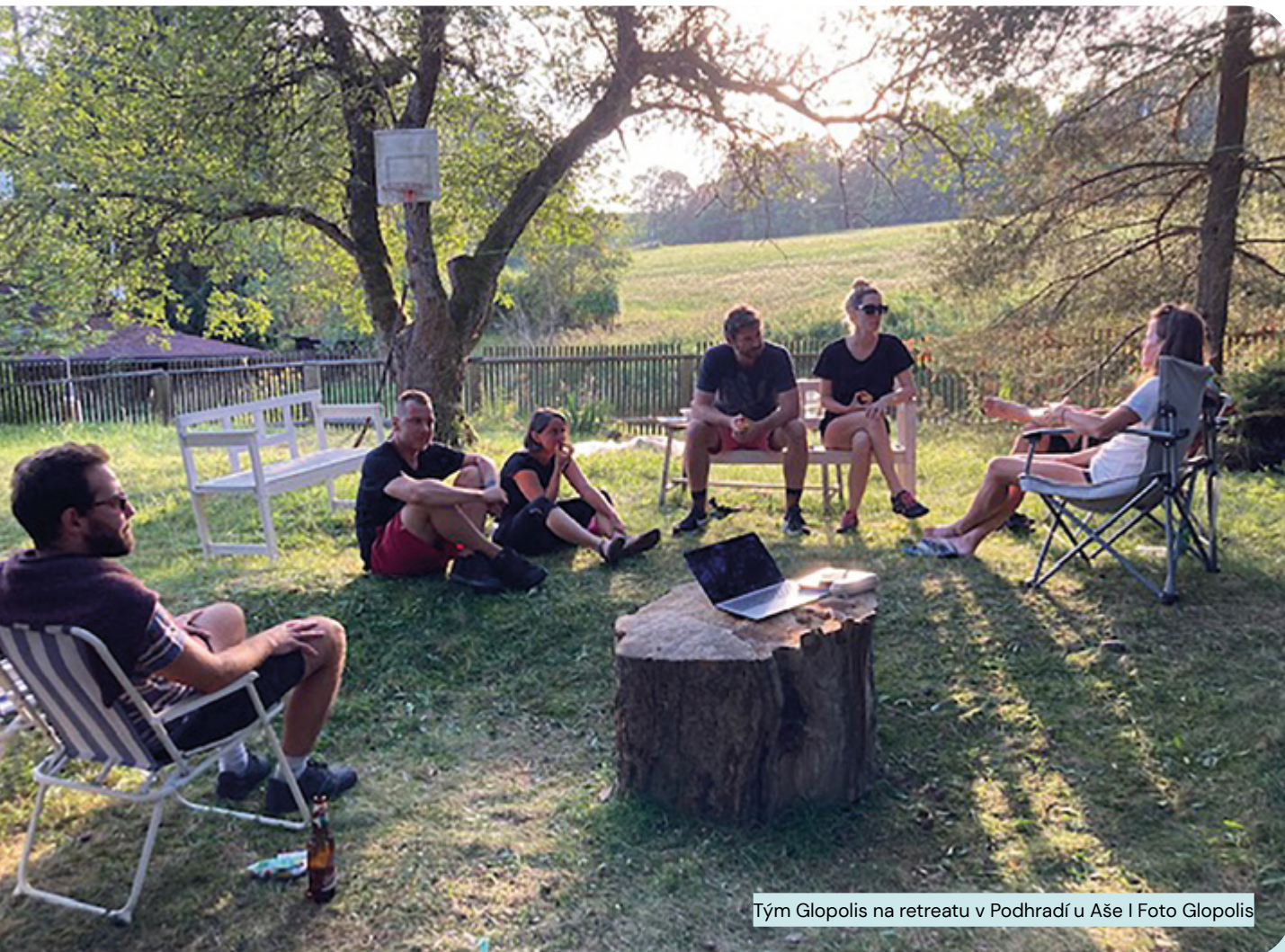
Tým Glopolis na retreatu v Podhradí u Aše