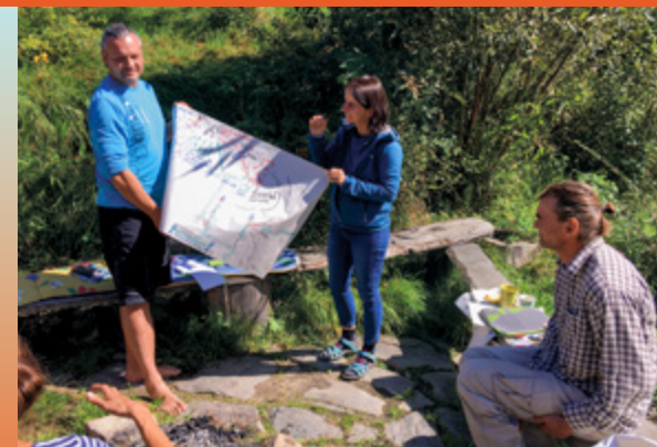
Setkání páteřní skupiny členů NeoN na Hájence u Českého Krumlova